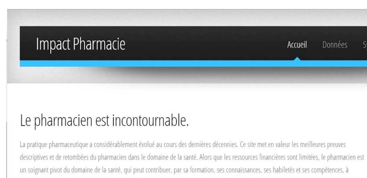
Fig3. Site Impact Pharmacie