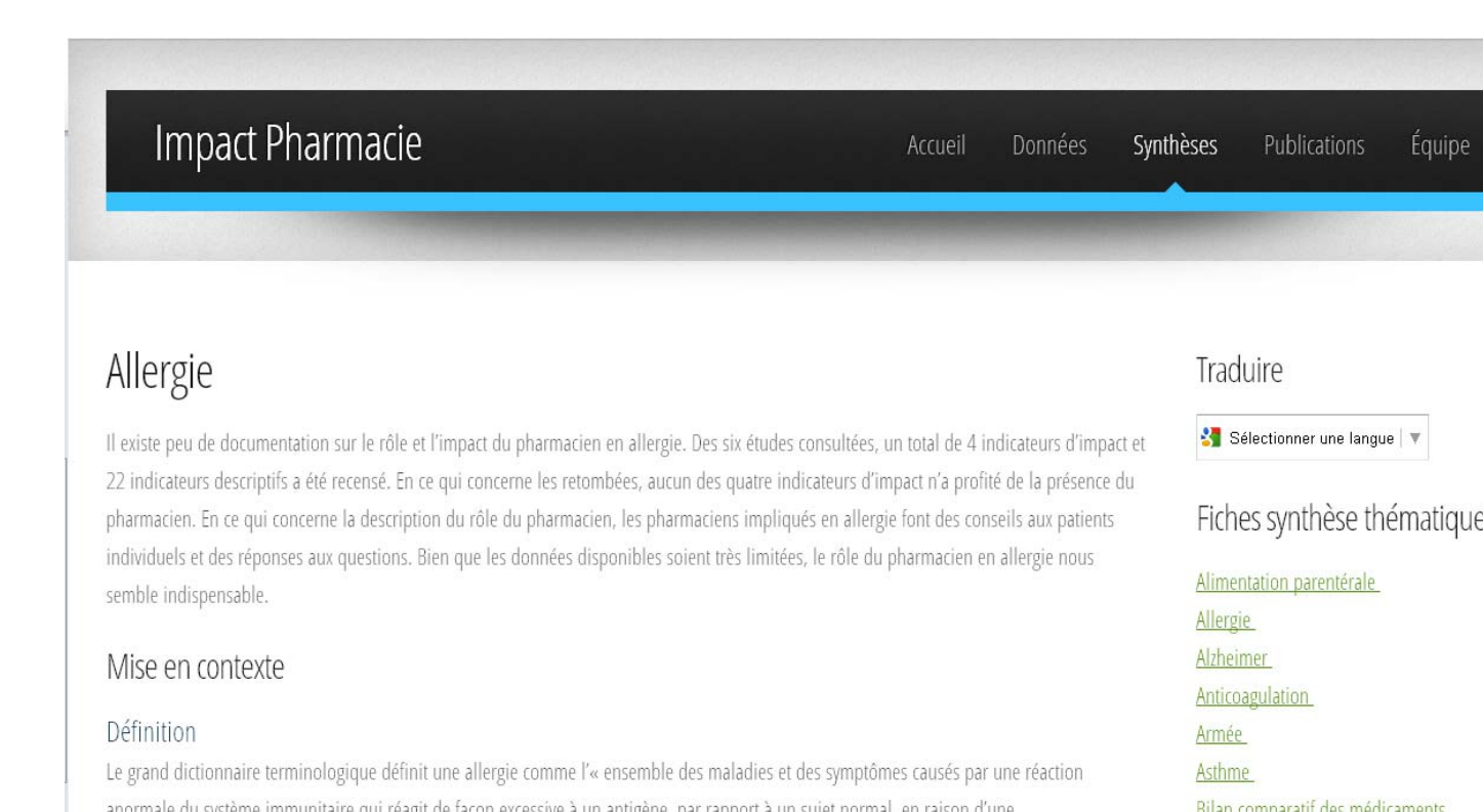
Fig2. Exemple de fiche synthèse