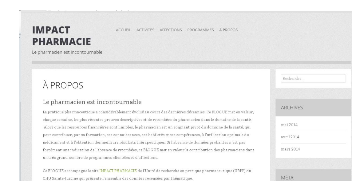
Fig4. Blogue Impact Pharmacie