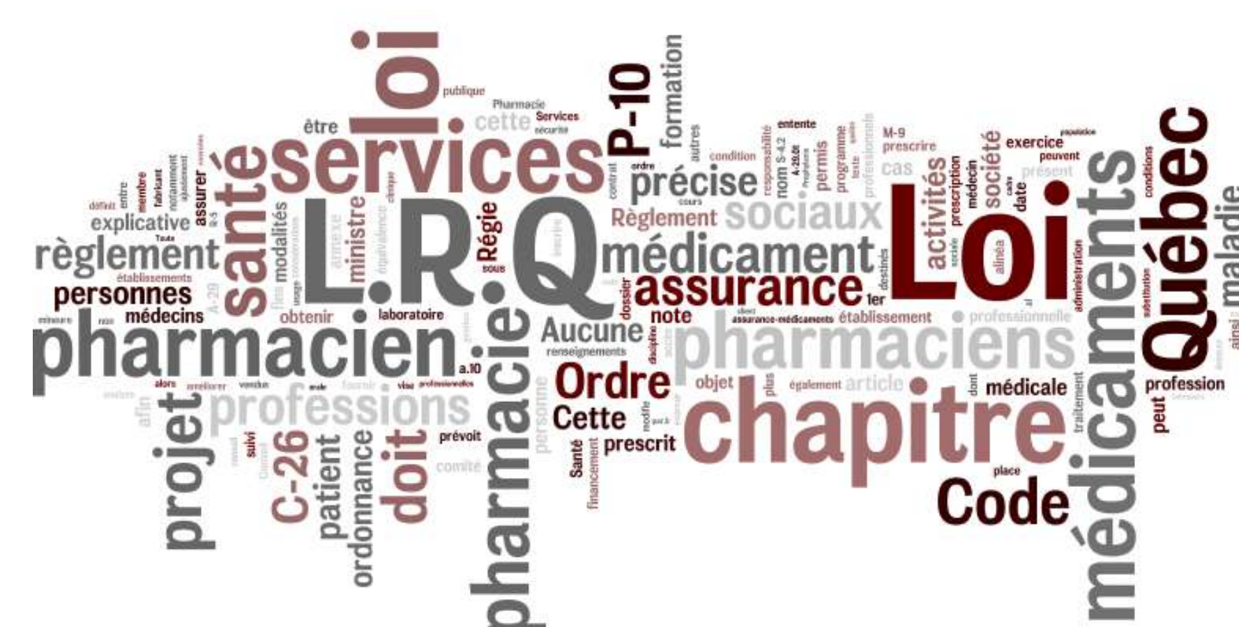
Figure 2—Mots clés du tableau synthèse classés par importance relative

La mise en forme s'en est suivie avec la publication sur le blogue LSS Pharmacie .