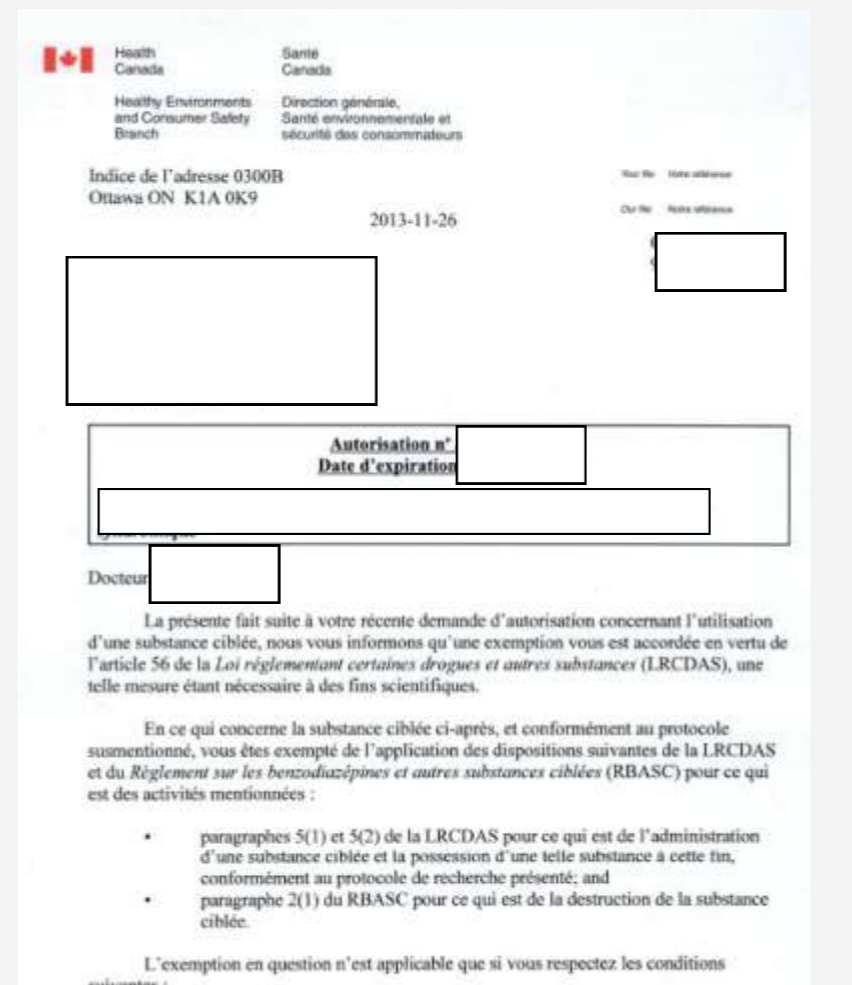
Fig. 3 Lettre d'autorisation