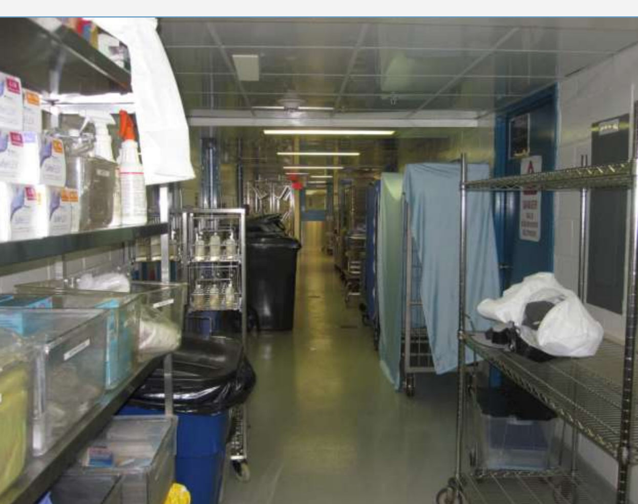
Fig. 1 Animalerie