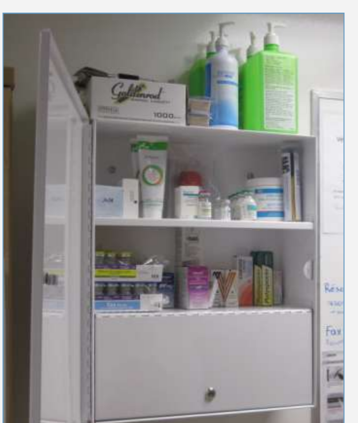
Fig. 2 Rangement des médicaments