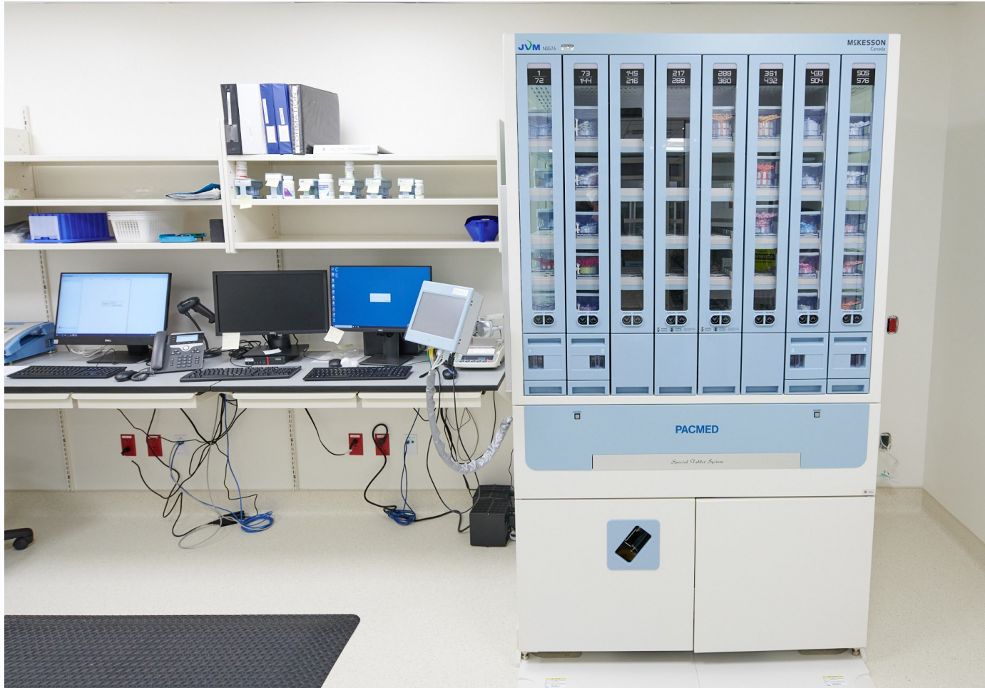
Fig 8 Zone d'ensachage (Pacmed  et aussi ensacheuse pour formats atypiques)