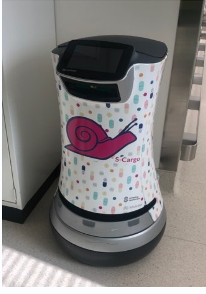
Fig 9 Robot de transport intra-d partement (S-Cargo)