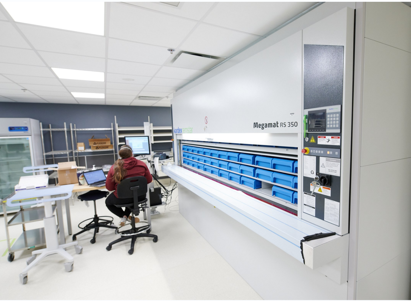
Fig 4 Reservice des m dicaments et carrousel