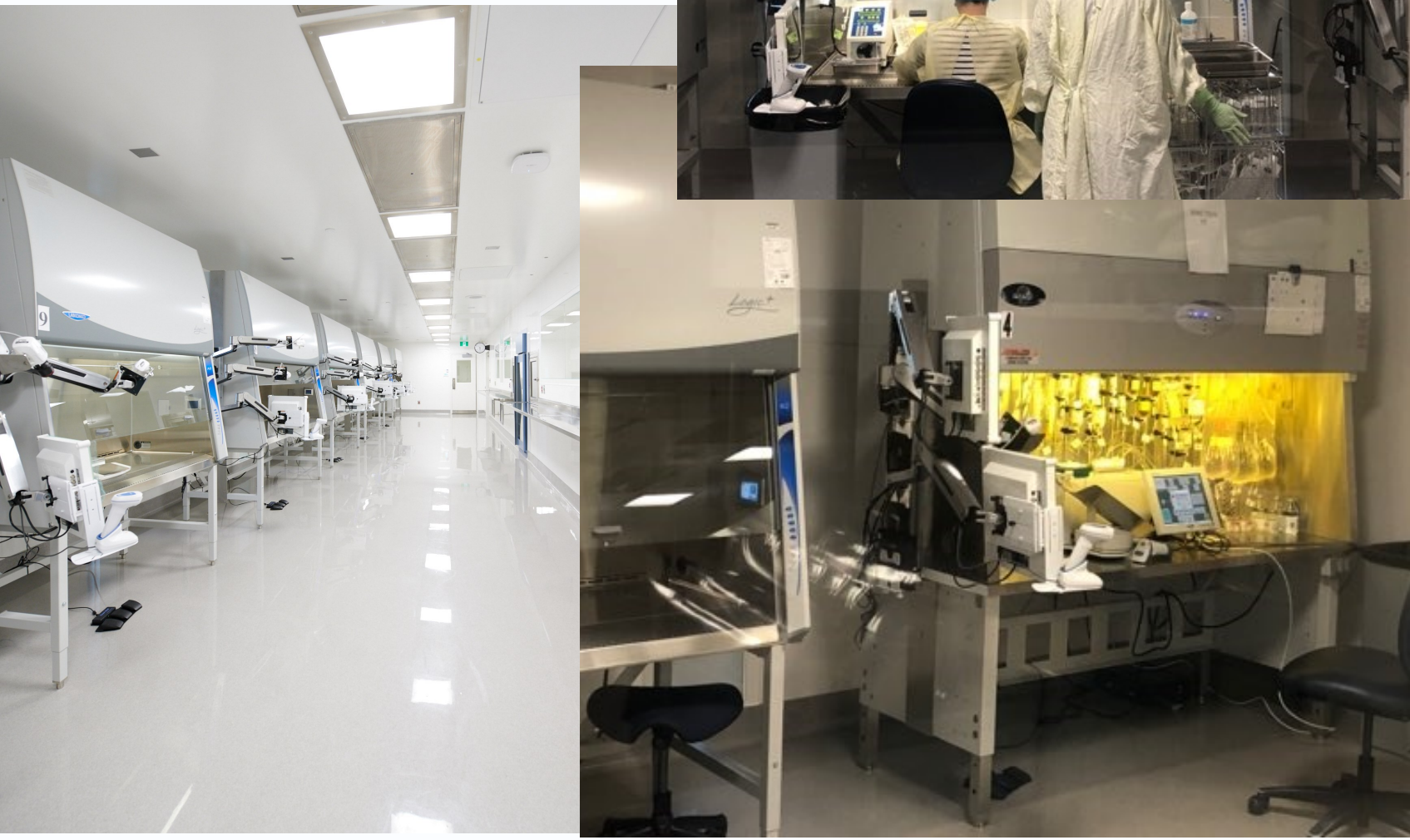
Fig 5 Une des trois salles blanches avec sept enceintes de type A2