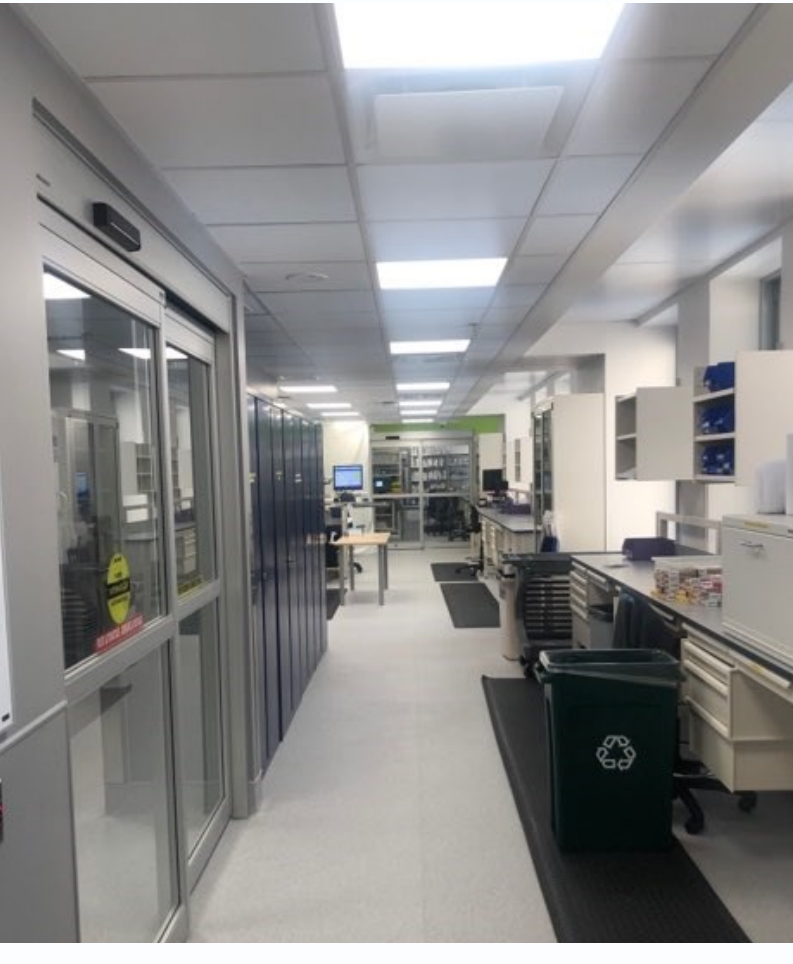
Fig 10 Zone pour remplissage des cabinets, plateaux et autres