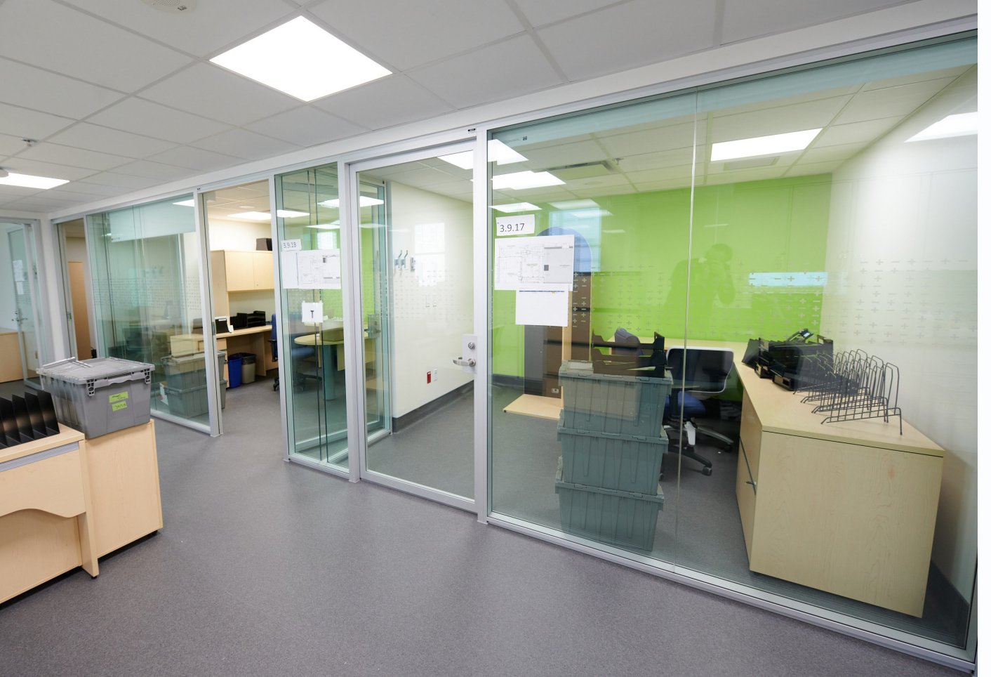
Fig 11 Bureaux de l' quipe de gestion