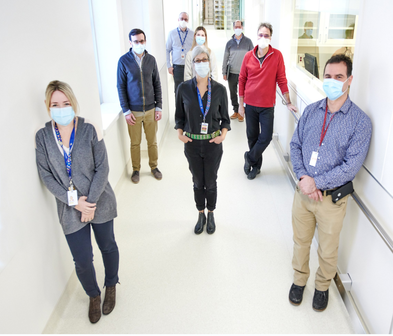
Fig 3 Quelques membres de l' quipe de planification du nouvel am nagement