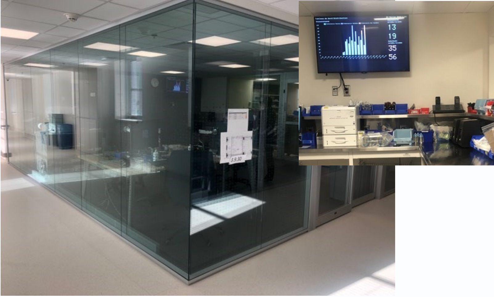
Fig 12 Zone de validation d'ordonnances et affichage du tableau de bord sur  cran g ant