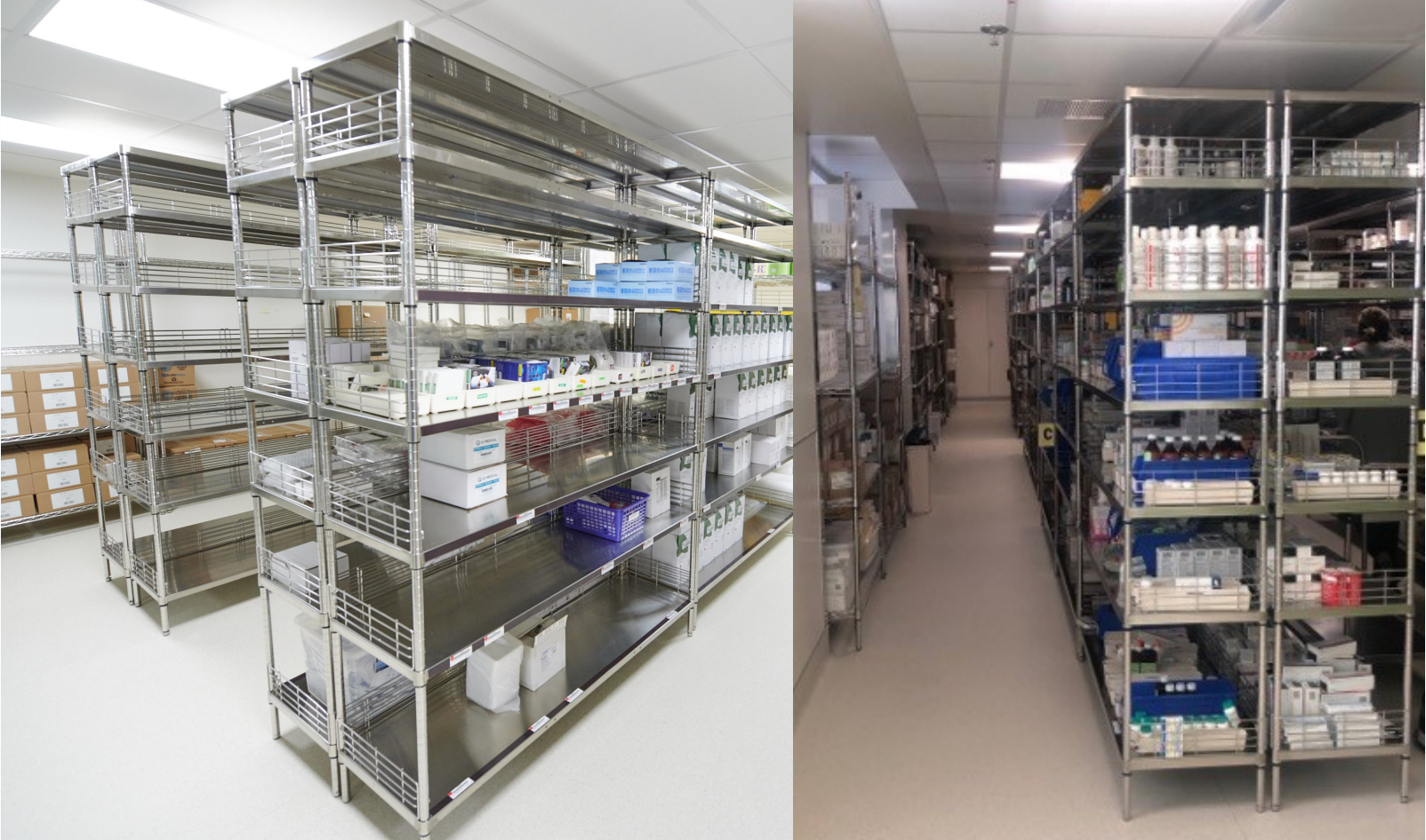
Fig 7 Zones d'entreposage de m dicaments et fournitures de soins