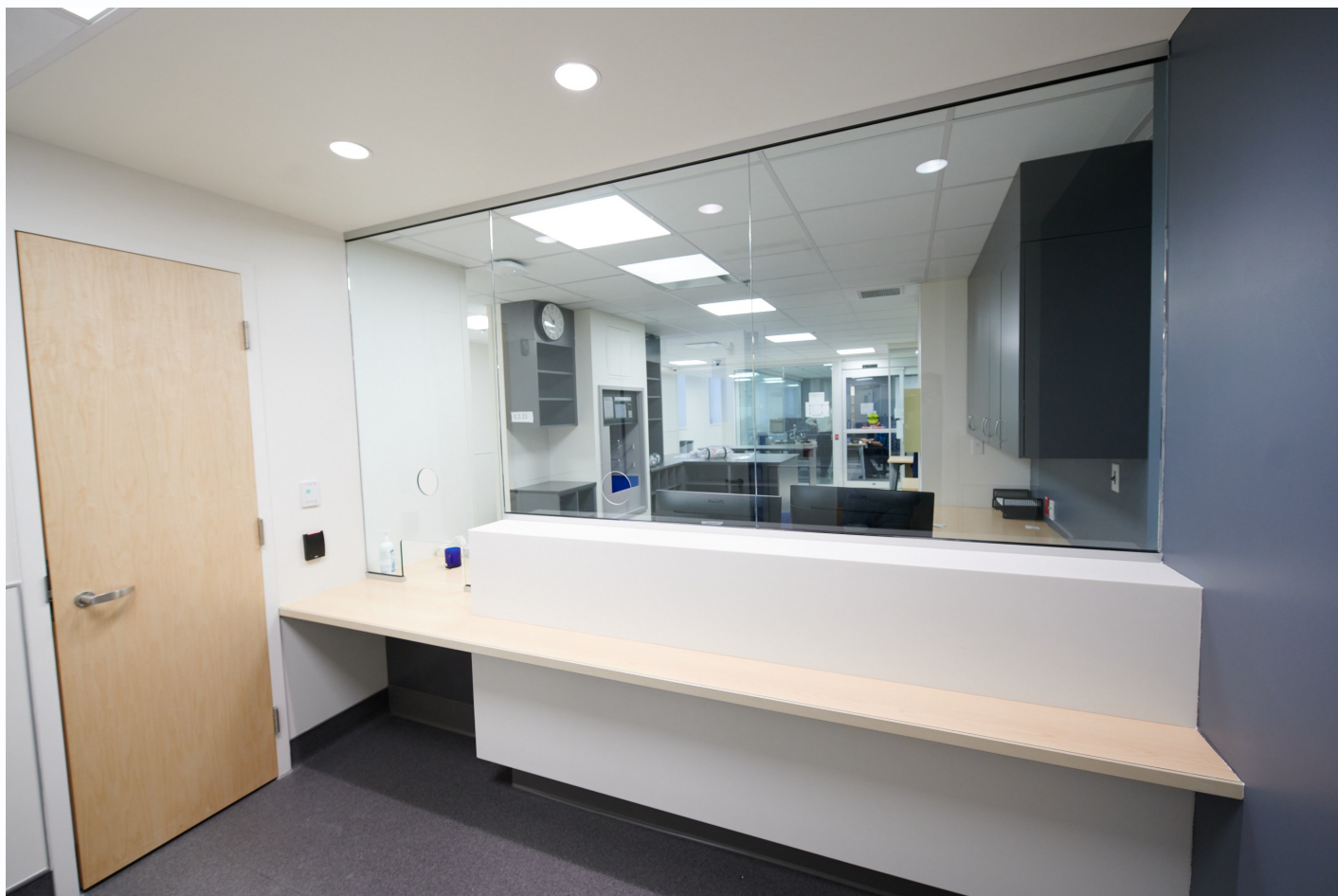
Fig 6 Accueil pour la client le et le personnel soignant